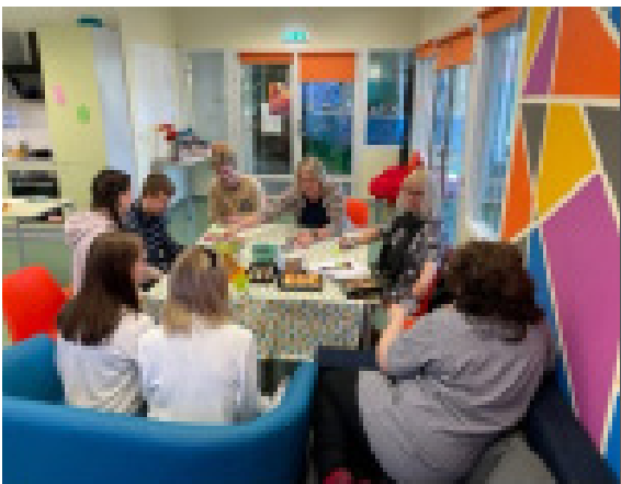
Joonis 1 - Kohtumised noortekoguga

Noortele mõeldud poliitikakujundamise koolitus põhines disainmõtlemise kasutamisel, kus noored said esmalt kaardistada probleemid, luua persona ja selle põhjal vajaliku teenuse disainida, mis omakorda sisaldas noore toetamise teekonna kirjeldust. Kohtuti nii veebis kui ka näost-näku. Oluline osa noortega koostöö suhete loomisel ja hoidmisel on olnud noortekeskuse noorsootöötajate kaasamine igas etapis. Nende kohalolek (usalduslik suhe noortega) aitas kiiremini noorteni jõuda.